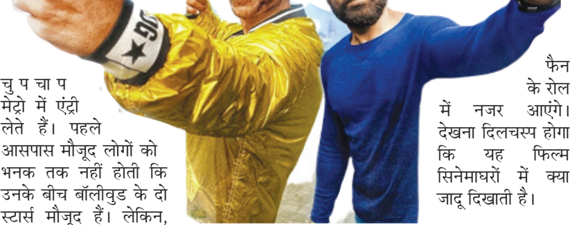
चुपचाप मेट्रो में एंड्री लेते हैं। पहले आसपास मौजूद लोगों को भनक तक नहीं होती कि उनके बीच बॉलीवुड के दो स्टार्स मौजूद हैं। लेकिन,

बता दें कि फिल्म 'सेल्फी' 24 फरवरी को रिलीज हो रही है। इस फिल्म का ट्रेलर रिलीज हो चुका है, जो काफी पसंद किया गया। फिल्म में अक्षय कुमार जहां सुपरस्टार हैं, वहीं इमरान हाशमी एक जबर